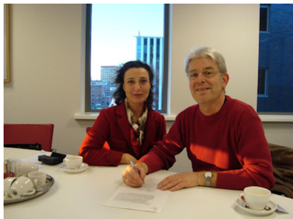
De ondertekening bij de notaris op 28 januari 2011

Enfin, de rest van het verhaal is bekend.